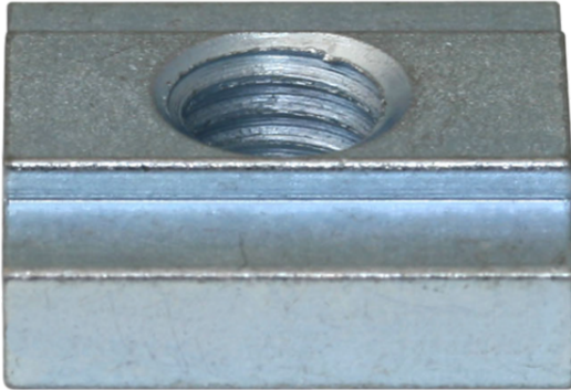
NUT-STEI 20x20 M6-IG 10