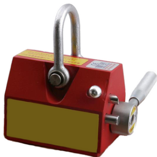
SGM 27 NEO30