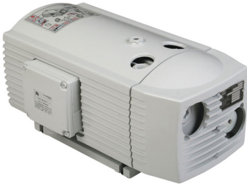
EVE-TR 50 AC3 VBV