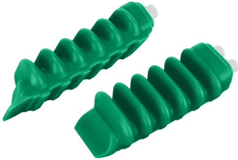
FINGER-SPARE-UNIT 6C IND