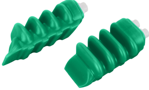
FINGER-SPARE-UNIT 4C IND