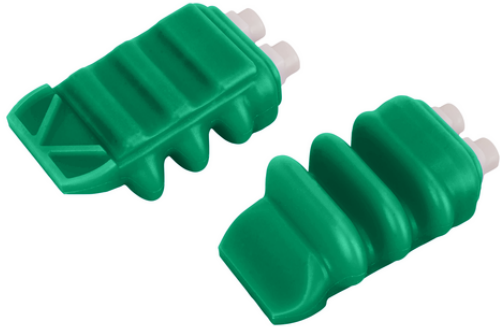
FINGER-SPARE-UNIT 3CV IND