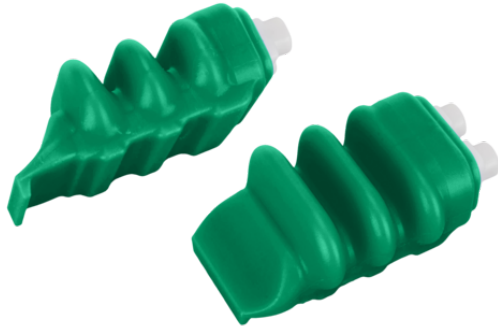
FINGER-SPARE-UNIT 3CA IND