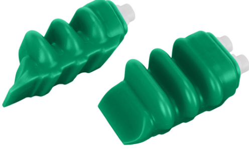
FINGER-SPARE-UNIT 3C IND