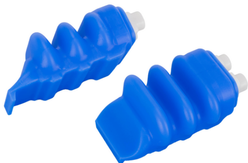
FINGER-SPARE-UNIT 3CA HYG