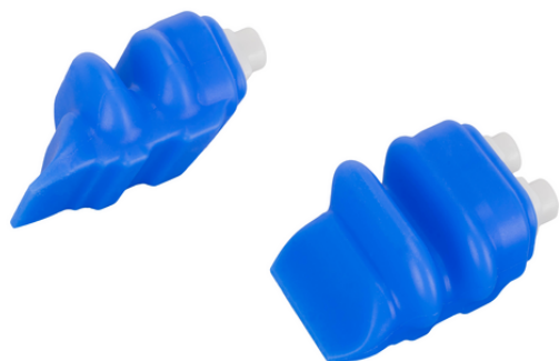
FINGER-SPARE-UNIT 2C HYG