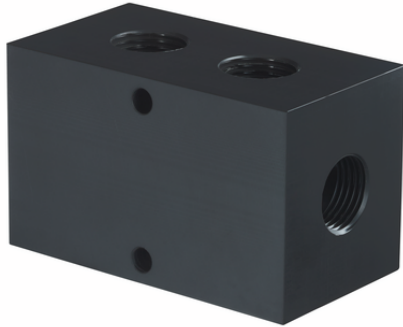
VTR G3/4-IG 5xG1/2 POM