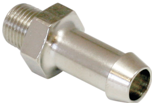
ST G1/8-AG 9 MS-V

Los accesorios para atornillar se suministran en la versión deseada.