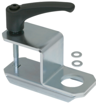
HTR-STS 50x50 D30 WI

Der Halter für Vierkantrohre HTR-STS wird als anschlussfertiges Produkt geliefert.