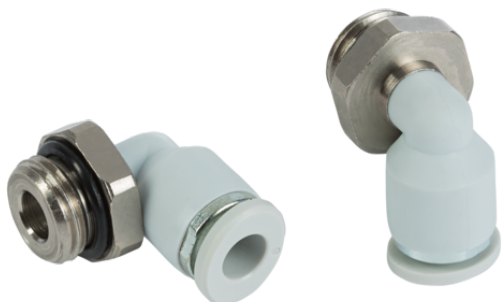
STV-W G1/4-AG 6

Вставные фитинги поставляются в нужном исполнении.