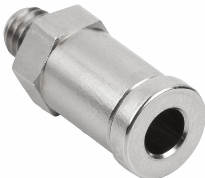
STV-GE M5-AG 4

ワンタッチホースコネクタはサイズ・仕様を幅広くご用意しております。ご注文時にご要望のサイズをお選びください。