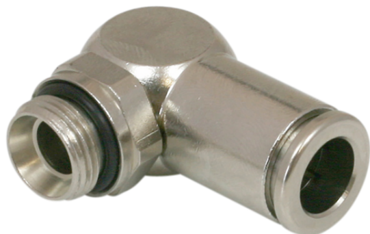
STV-W G1/4-AG 6

Los racores se suministran en la versión deseada.