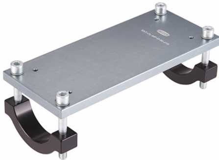
SXT-CL-MP D 40 215