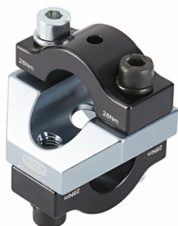
SXT-CL X MOD 25 AL 1IN

I pezzi di bloccaggio SXT-CL viene fornito come prodotto finito per connessione.