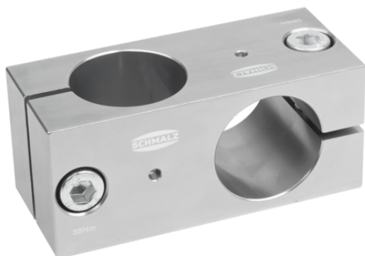
SXT-CL X FIX 40 40 AL

I pezzi di bloccaggio SXT-CL viene fornito come prodotto finito per connessione.