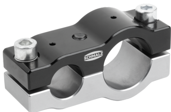
SXT-CL P 25 40 AL