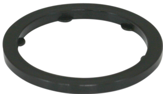
DR G1/4 PA Easy-Fix

Junta anular se suministra en el diámetro deseado.