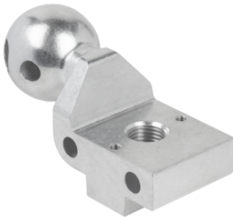
HT-SG A3 E 35 M10-IG

真空パッド用ホルダー HT-SG Eは、すぐに接続可能な製品として納入されます。