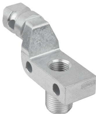
HT-SG A2 22 NPT3/8-AG