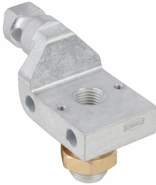
HT-SG A2 E 35 G3/8-AG

Die Halter für Sauggreifer HT-SG E werden als anschlussfertiges Produkt geliefert.