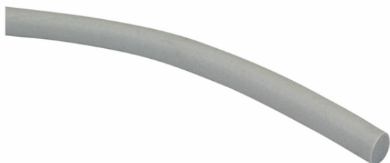
DI-SCHN 4 MOS EPDM-20