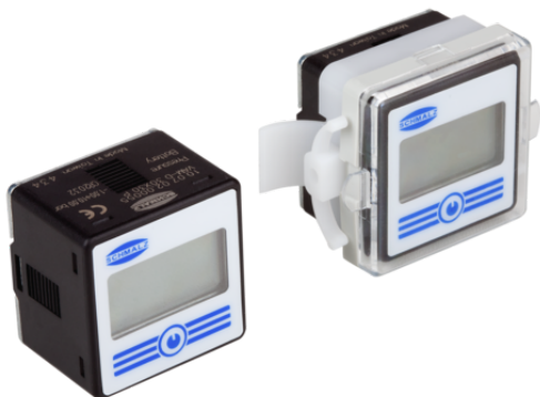
VAM-D 30x30 VP10 G1/8-AG

Manómetro electrónico VAM-D con indicación digital se suministra como producto listo para su conexión.