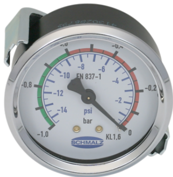
VAM 67 V H-SE BAR/PSI

El manómetro VAM se suministra como producto listo para su conexión.