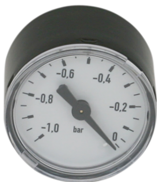
VAM 40 V H BAR

El manómetro VAM se suministra como producto listo para su conexión.