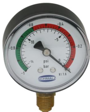
VAM 63 V U BAR/PSI

El manómetro VAM se suministra como producto listo para su conexión.