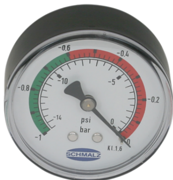
VAM 63 V H BAR/PSI

El manómetro VAM se suministra como producto listo para su conexión.