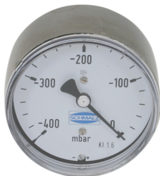
VAM 63 V400 H BAR

El manómetro VAM se suministra como producto listo para su conexión.