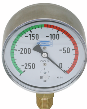
VAM 100 V250 U BAR

El manómetro VAM se suministra como producto listo para su conexión.