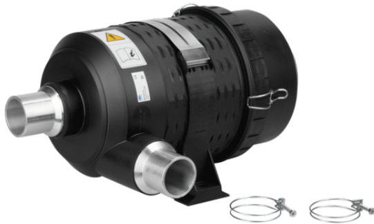
STF 60 P 8.0

Der Vakuum-Filter VF / STF / STF-D wird als anschlussfertiges Produkt geliefert.