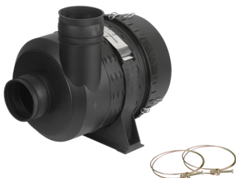
STF 110 P 12.0 SSB

Il filtro per vuoto VF / STF / STF-D viene fornito come prodotto finito per connessione.