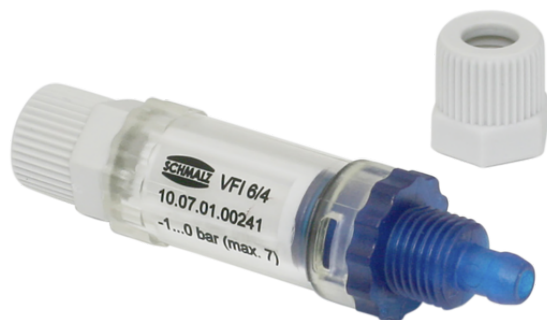
VFI CN6/4 50