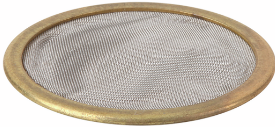
SIEB 19.5x1 MS 100