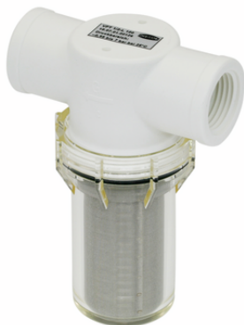
VFT G1/2-IG 100

El filtro de vacío tipo taza VFT se suministra como producto listo para su conexión.