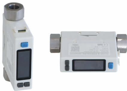
FS 5 D 2PA K

El producto se suministra como componente listo para enchufar. Se incluye un cable de 3 m de largo con hilos abiertos.