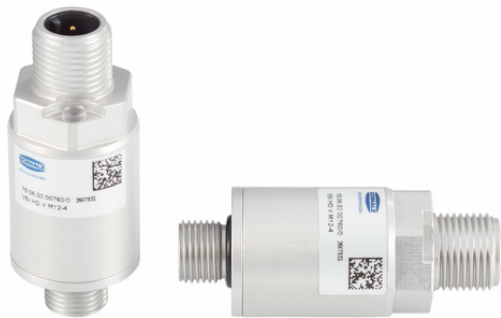
VSi HD V M12-4

El VSi-HD se suministra como un producto listo para conectar (sin cable de conexión).