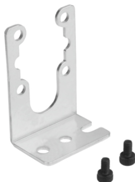
BEF-WIN 20x43.5x29.5 1.5