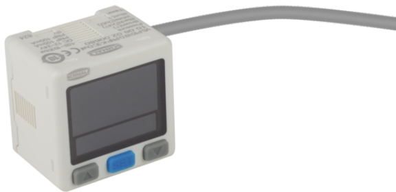
VS-P10-W-D PNP K 3C-D

El vacuostato y presostato VS-V/P-W-D-K-3C-D se suministra como producto listo para su conexión.