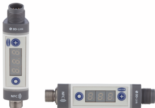
VSi VP8 D M12-4

Il vacuostato e pressostato VSi viene fornito come prodotto finito per connessione (senza cavo di connessione). Il prodotto è costituito da: