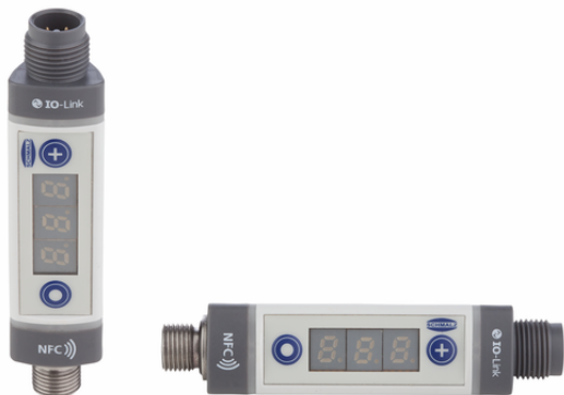
VSi V D M12-4

El vacuostato y presostato VSi se suministra como producto listo para su conexión (cables no incluidos). El producto se compone de: