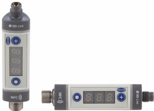
VSi P10 D M8-4