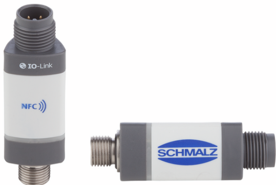
VSi V M12-4

El vacuostato y presostato VSi se suministra como producto listo para su conexión (cables no incluidos). El producto se compone de: