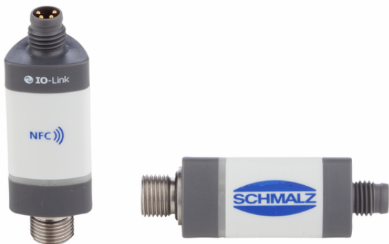
VSi V M8-4