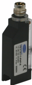
VS-V-AV-T-PNP M8-4 S