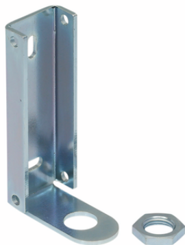
BEF-WIN 21x22x60.5 1.5 VS