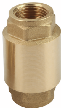
RSV 18 G1/2-IG MS