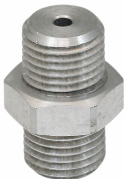
SW 100 G1/4-AG

La resistenza di flusso SW viene fornito come prodotto finito per connessione.